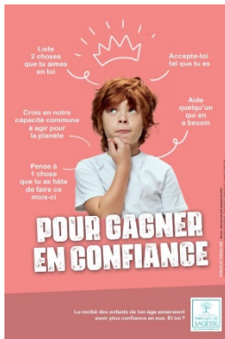
Affiche 1er degré