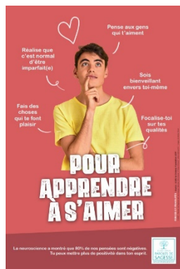
Affiche 2nd degré