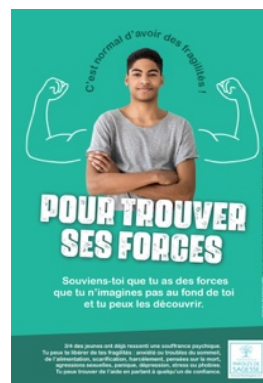
Affiche 2 nd degré