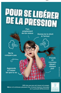
Affiche 1er degré