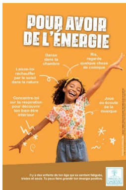
Affiche 1er degré