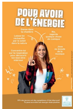
Affiche 2nd degré