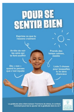
Affiche 1er degré