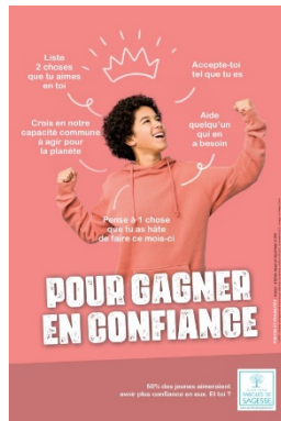
Affiche 2nd degré