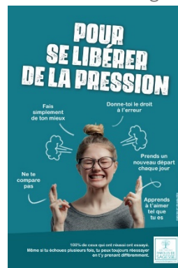
Affiche 2nd degré