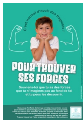
Affiche 1 er degré