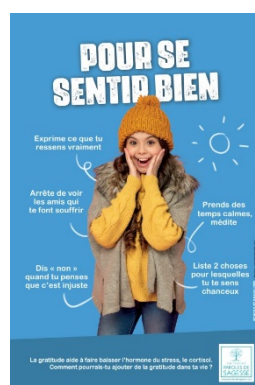
Affiche 2nd degré