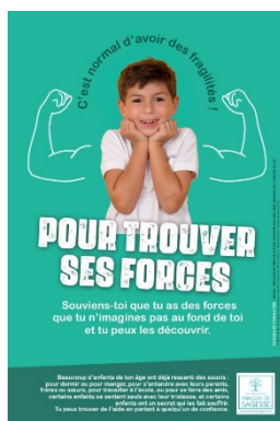
Affiche 1er degré