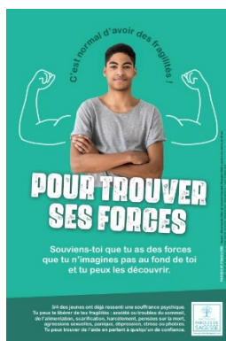
Affiche 2nd degré