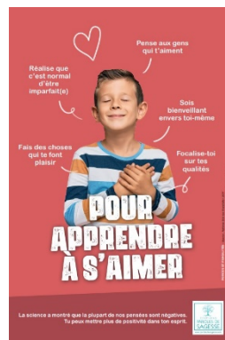
Affiche 1er degré