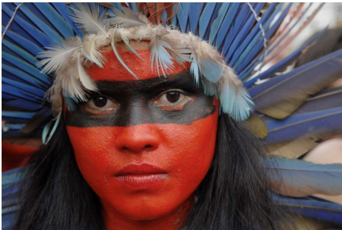
Portrait d'une jeune femme indigène au Brésil. Reconnus et protégés par la Constitution de 1988, les peuples indigènes de l'Amazonie brésilienne sont pourtant de plus en plus menacés par l'exploitation des matières premières.

Vous pouvez leur expliquer qu'une fraternité ouverte permet de reconnaître, de valoriser et d'aimer chaque personne, peu importe où elle est née ou habite. Vous pouvez leur montrer cette photo d'une jeune femme indigène au Brésil et leur demander comment ils peuvent ressentir un lien de fraternité avec elle ? Vous pouvez leur rappeler qu'il n'y a pas de bonne ou mauvaise réponse à cette question. Mais uniquement des pistes de réflexions et de discussion.